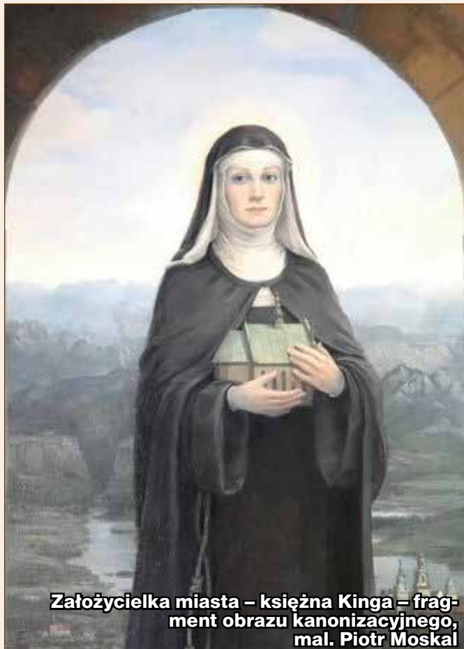
Założycielka miasta – księżna Kinga – fragment obrazu kanonizacyjnego, mal. Piotr Moskal

Tego samego 1273 r., na mocy innego dokumentu, wydanego kilka miesięcy wcześniej, książę Bolesław Wstydlivy (w porozumieniu za swą małżonką Kingą) zwołał