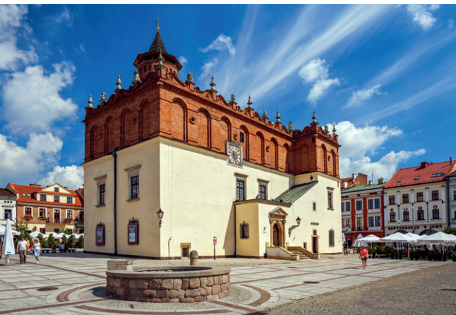
Ratusz w Tarnowie