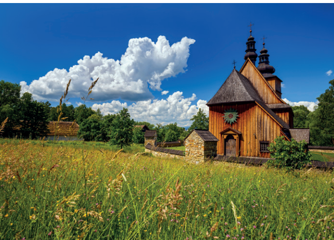
Sądecki Park Etnograficzny