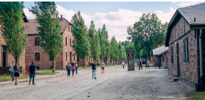
Muzeum i Miejsce Pamięci Auschwitz-Birkenau

W ostatnich latach realizowany jest projekt zagospodarowania przestrzeni miejskiej „Oświęcimska Przestrzeń Spotkań”. Jest to pomysł na stworzenie pomostu pomiędzy Muzeum Auschwitz-Birkenau a współczesnym, prężnie rozwijającym się miastem i jego bogatą, ponad 800-letnią historią. Projekt ma połączyć takie elementy, jak historia, kultura i przyroda, i służyć nie tylko turystom, ale też mieszkańcom miasta.