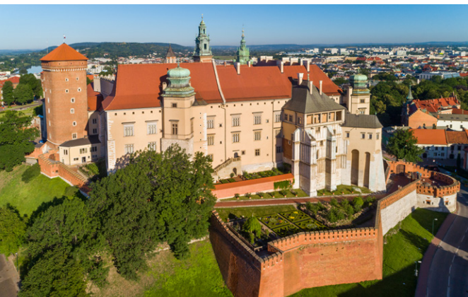
Wawel, fot. S. Rakowski Rynek Główny, fot. S. Rakowski