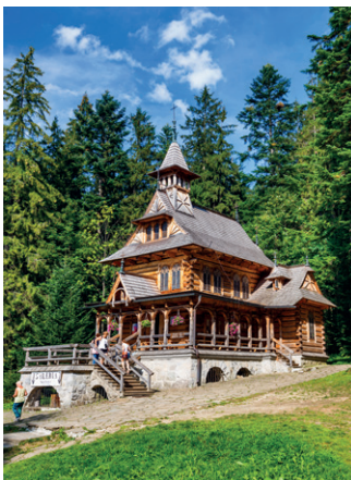
Jaszczurówka

Mieczysława Karłowicza i Oswalda Balzera. Tuż obok stoi najstarszy kościół Zakopanego , drewniana świątynia św. Klemensa i MB Częstochowskiej z 1847 r. Kilka kilometrów od centrum wznosi się jedna z najmłodszych świątyń w mieście, czyli Sanktuarium MB Fatimskiej na Krzeptówkach . Wzniesiono je w latach 80. ubiegłego wieku jako wotum za ocalenie papieża Jana Pawła II podczas zamachu na jego życie 13 maja 1981 r.