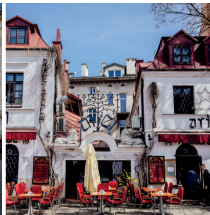
ul. Szeroka na Kazimierzu