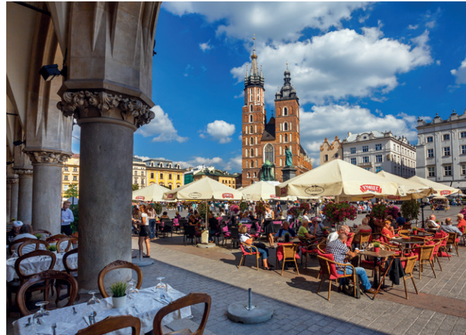
Rynek w Krakowie