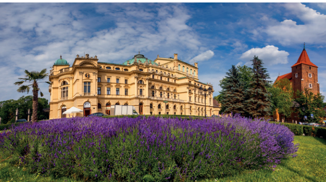
Teatr im. Juliusza Słowackiego, fot. K. Bańkowski Dama z Gronostajem, fot. M. Zaręba

Teatr im. J. Słowackiego czy piękne secesyjne kamienice w kwartałach wokół krakowskich Plant. Perłą współczesnej architektury jest dzieło sławnego japońskiego mistrza architektury Araty Isozaki, czyli Muzeum Sztuki i Techniki Japońskiej Manggha .