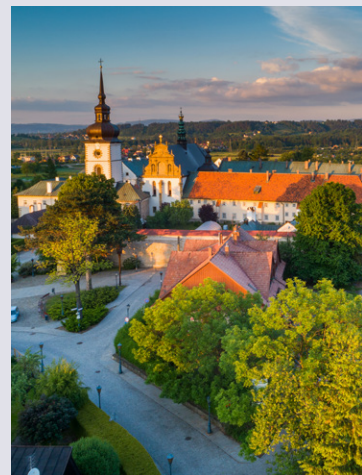
Stary Sącz

Stary Sącz z ponad 700-letnim klasztorem Klarysek . Niedaleko od klasztoru, na łąkach nad Popradem, stoi ołtarz papieski . To pamiątka po uroczystej mszy świętej w 1999 r. Stary Sącz zachował także średniowieczny układ urbanistyczny z rozległym, brukowanym rynkem , z którego rozchodzą się wąskie, ciche uliczki. Rytró , gdzie na stromym wzgórzu widać ruiny XIII-wiecznego zameczyska . W Rytrze kończy się trasa splywu Popradem . Na specjalnych tratwach pokonuje się piękny, 10-kilometrowy odcinek rzeki od niewielkiego uzdrowiska w Piwnicznej-Zdroju . W samym Rytrze atrakcją jest długi wyciąg krzeselkowy stacji narciarskiej, wywożący turystów na szczyt Jastrzębskiej Góry. W Rytrze zaczynają się także długie, malownicze szlaki turystyczne, wiodące na najwyższą górę Beskidu Sądeckiego, Radziejową (1266 m n.p.m.). Na północ od Nowego Sącza można udać się z biegiem Dunajca nad brzegi zaporowego Jeziora Rożnowskiego . Akwen doskonale służy celom wypoczynkowym: są tu miejsca do kąpieli, a także liczne przystanie ze sprzętem wodnym.