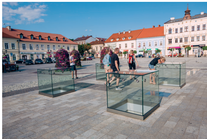
Rynek w Oświęcimiu

w Oświęcimiu społeczności żydowskiej, w różnych okresach stanowiącej blisko połowę mieszkańców miasta.