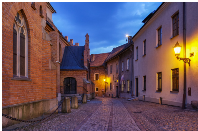
Tarnów

Ponad zabudowę starego miasta wyrasta potężna bryła ceglanej Bazyliki Katedralnej , z wysoką na 72 m wieżą. Jej wnętrze to prawdziwe muzeum. Monumentalne pomniki nagrobne – renesansowy rod Tarnowskich oraz manierystyczny Ostrogskich - należą do najwspanialszych tego typu dzieł w kraju. Z kolei postać Barbary z Tęczyńskich Tarnowskiej, pierwszej żony hetmana Jana Tarnowskiego, z pomnika