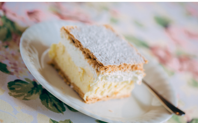
Kremówka papieska

jego następcą na Stolicy Piotrowej, papież Benedykt XVI.