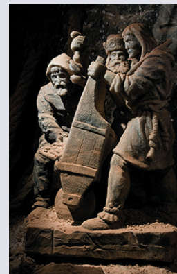
Kopalnia w Bochni

Winnice regionu tarnowskiego , które w ramach produktu ENOTarnowskie, oferują wyjątkowe doznania dla ciała i ducha, zbudowane wokół turystyki winiarskiej.