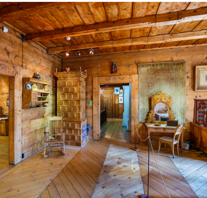
Willa Koliba