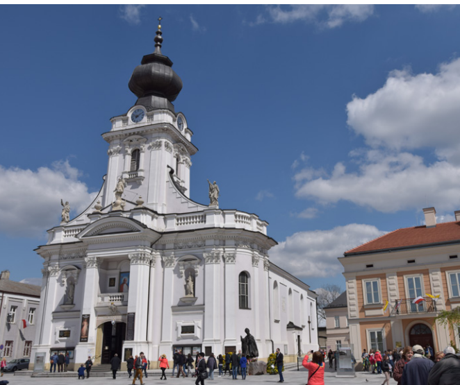
Bazylika Ofiarowania NMP i Muzeum Dom Rodzinny Ojca Świętego Jana Pawła II