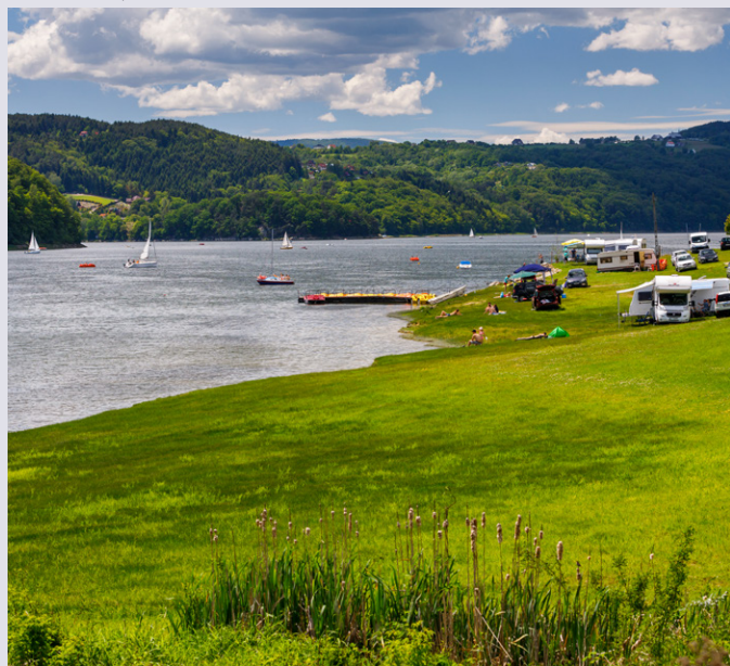
Jeziro Rożnowskie