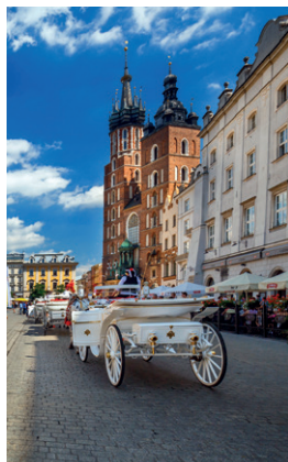
Kościół Mariacki