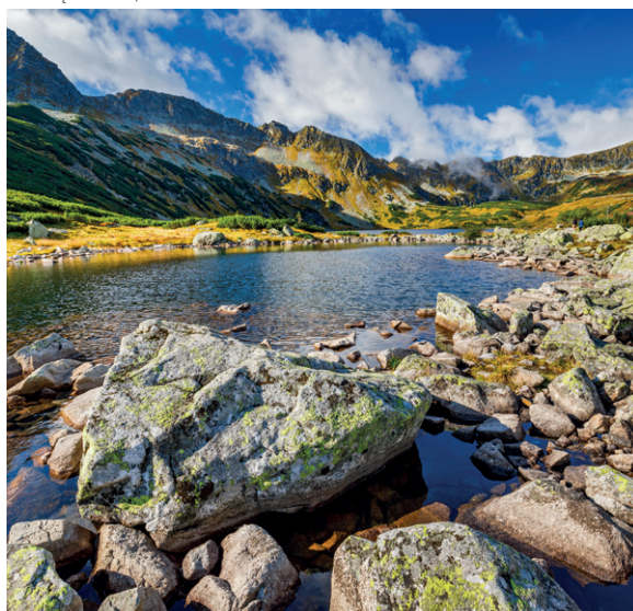
Dolina Pięciu Stawów

Chochołów – miejscowość, gdzie niemal wszystkie domy we wsi to stare chałupy góralskie, zbudowane w konstrukcji zrębowej z potężnych pni jodłowych. Chaty, ustawione poprzecznie do przecinającej wieś ulicy, tworzą niepowtarzalny zespół zabudowy , jedyny tego typu na całym Podhalu.