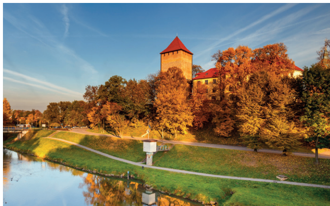
Oświęcim – zamek nad Sołą