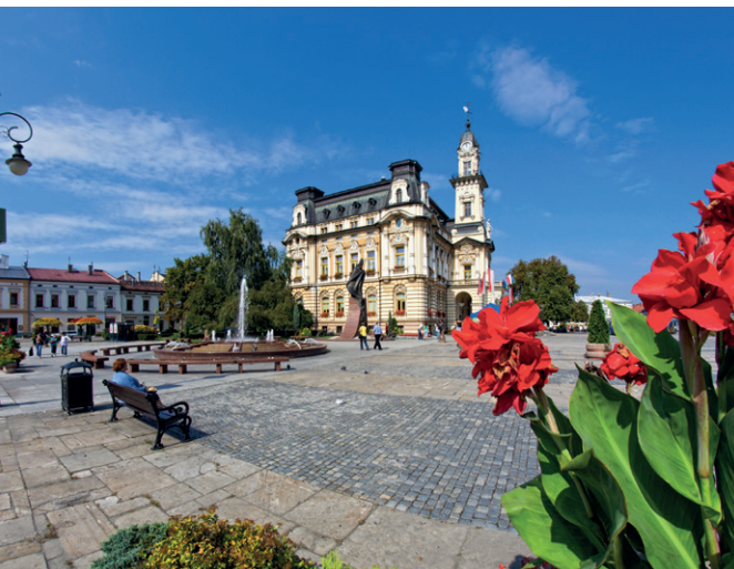
Rynek w Nowym Sączu