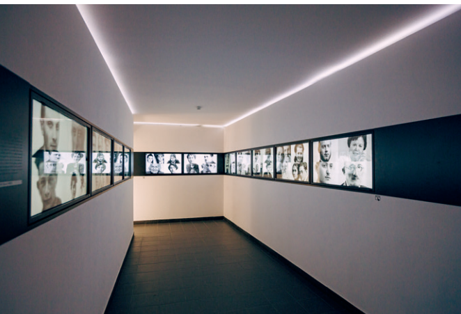
Muzeum Żydowskie w Oświęcimiu, fot. K. Syga W Synagodze Chewra Lomdei Misznajot, fot. K. Syga