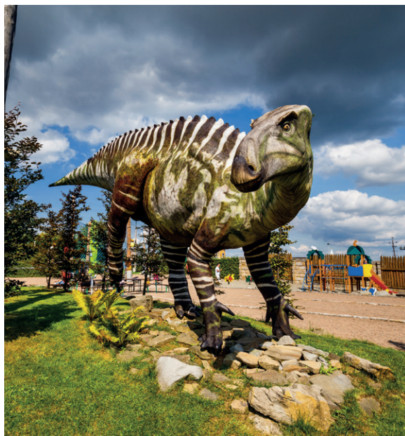
Dinolandia, fot. K. Bańkowski

Dwór w Stryzowie - obiekt obronny wybudowany w XVI w., a przebudowany w XVIII w. Wnętrze dworu przedstawia mieszkanie średnio zamożnego szlachcica żyjącego w XIX w. Jest ono bogato wyposażone w meble. Niektóre z nich dawni właściciele sprowadzili z Wiednia lub Paryża.