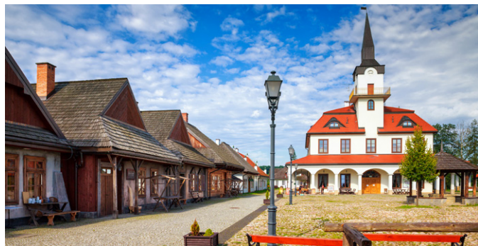
Miasteczko Galiczyńskie

W Nowym Sączu do dziś przetrwał średniowieczny układ urbanistyczny miasta z dużym rynkiem . Na środku placu wznosi się okazały neobarokowy ratusz z wieżą i czterema narożnymi ryzalitami oraz bogatą dekoracją fasad. Będąc blisko rynku, warto zajrzeć do gotyckiej bazyliki św. Małgorzaty z XIII i XIV w. Dwunawowa świątynia wzniesiona jest z kamienia i cegły, a do fasady dobudowane są dwie masywne wieże. Niedaleko znajduje się Dom Gotycki , jeden z oddziałów miejscowego Muzeum Okręgowego . Można tu zobaczyć wiele ciekawych eksponatów związanych ze sztuką, kulturą i historią miasta oraz regionu Sądecczyzny. Aby dowiedzieć się, jak w XIX w. wyglądało mieszkanie zamożnego nowosądeckiego mieszczanina, można udać się do jednej z kamienic na rynku, mieszczącej oddział muzeum okręgowo: Galerię Marii Ritter i Stare Wnętrza Mieszkańskie .