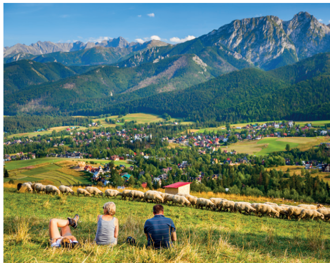
Na Gubałówce

Symbolem miasta są budynki w stylu zakopiańskim , doskonale komponującym się z tatrzańskim pejzażem. Styl ten narodził się pod koniec XIX w., a jego głównym twórcą był Stanisław Witkiewicz, ojciec sławnego Witkacego. Najstarszym budynkiem zbudowanym według założeń Witkiewicza jest Willa Koliba , wzniesiona z drewna w latach 1892–93, o konstrukcji zrębowej; dziś mieści się w niej Muzeum Stylu Zakopiańskiego. Szczególną malowniczością bryły wyróżniają się późniejszy Dom Pod Jedłami z wysoką, kamienną podmurówką, licznymi okapami, facjatami i dekoracjami rzeźbiarskimi. Klasycznym przykładem stylu zakopiańskiego jest również niewielka kaplica na Jaszczurówce .