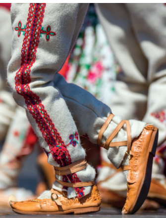
Strój ludowy