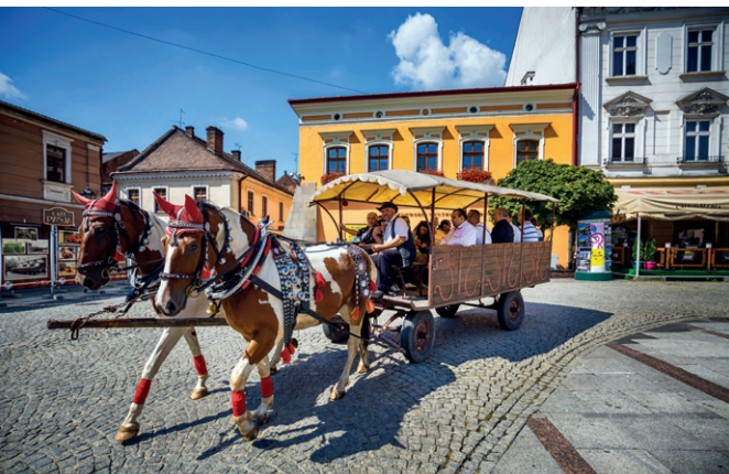
Międzynarodowy Tabor Pamięci Romów

kryje wewnątrz z barokową polichromią i siedemnastowiecznym cudownym obrazem Matki Bożej. Drugi kościół, p.w. Trójcy Przenajświętszej „na Terlikówce” , wzniesiono w 1597 r. W późnorenansowym ołtarzu głównym znajduje się obraz Trójcy Przenajświętszej w typie Tronu Łaski, namalowany na desce ok. 1600 r.