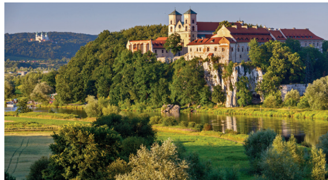
Opactwo Benedyktynów w Tyńcu

prezentuje przede wszystkim Muzeum Sztuki Współczesnej (MOCAK) w dzielnicy Zabłocie. Tuż obok, w dawnej fabryce naczyń emaliowanych, mieści się Fabryka Schindlera – muzeum z ekspozycją poświęconą okupacji niemieckiej w czasie II wojny światowej.